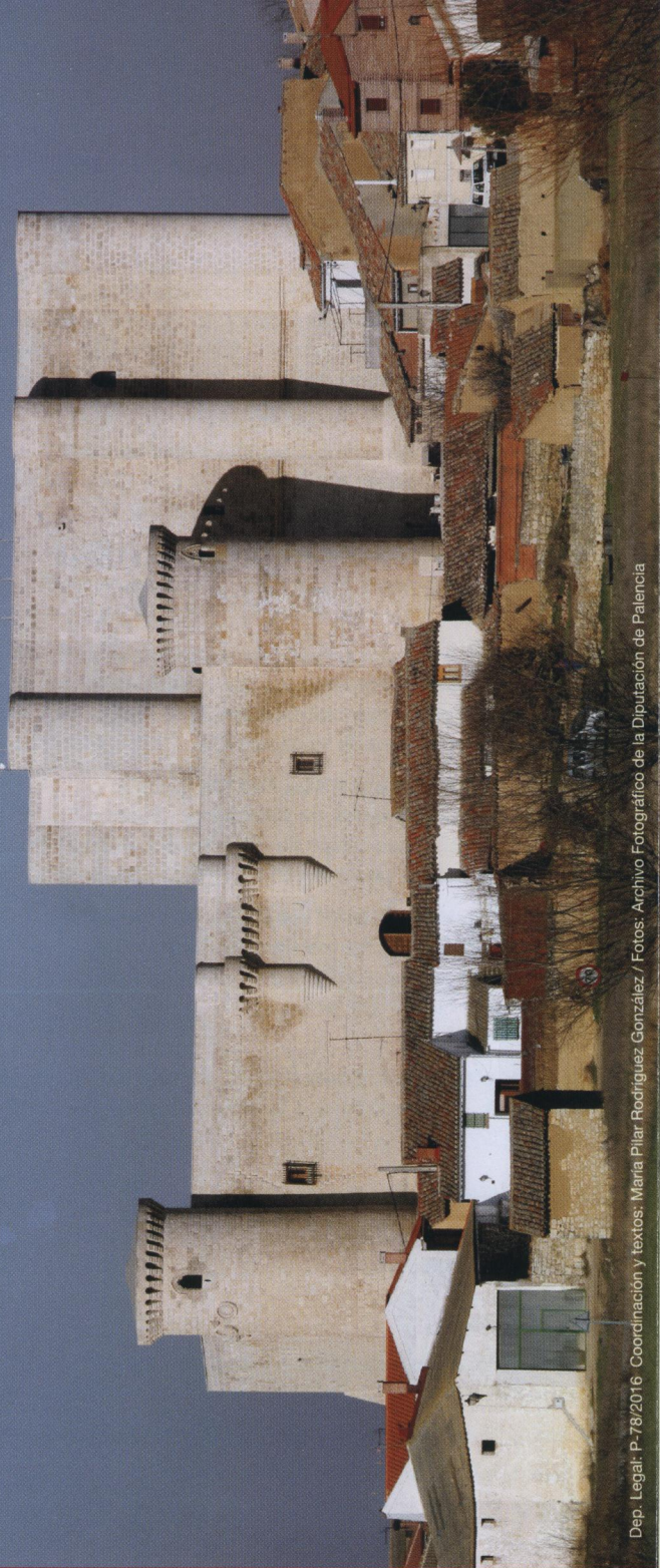
Dep. Legal: P-78/2016 Coordinación y textos: María Pilar Rodríguez González

Fue su descendiente Andrés de Ribera (hijo), segundo señor de Fuentes, trágico protagonista de uno de los hechos más relevantes en la historia del Castillo: en enero de 1521 sufrió en el Castillo el asedio de los Comuneros a las ordenes del Obispo Acuña , a quien permitió la entrada en la fortaleza tras negociar una capitulación honrosa que el Obispo traicionó apresando a toda su familia y saqueando todo lo de valor que había. El Castillo permaneció en poder de los Comuneros hasta finales de abril de 1521, después de que fueran derrotados en la Batalla de Villalar.